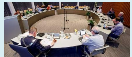
Kansen voor 1,5 meter-democratie