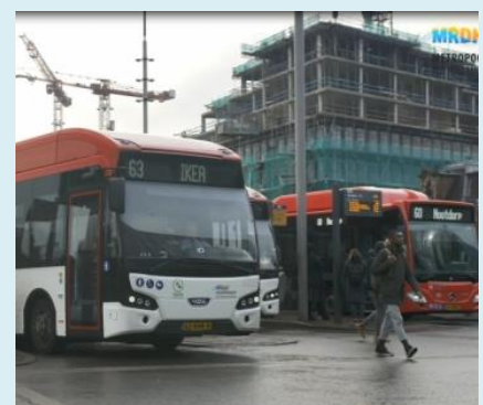
Ruimere mogelijkheden openbaar vervoer