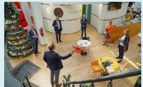
Update Greenport West-Holland